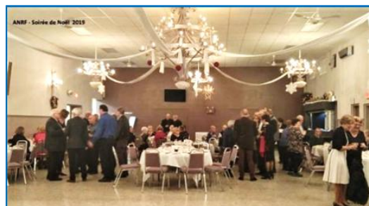
Une belle soirée pour les participants