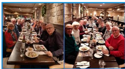
Souper des bénévoles du 5 décembre 2019