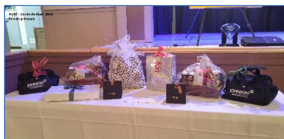
Nombreux prix de présence ! Voir les photos des gagnants ici