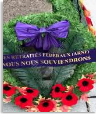
Couronne déposée à la base militaire de Bagotville le 11 novembre 2020