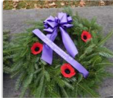
Couronne déposée au Cénotaphe de New Richmond le 11 novembre 2020

Le 2 novembre dernier, notre Section a fait parvenir aux membres un communiqué exprimant toute notre gratitude envers les vétérans et les vétérans à travers le pays qui méritent d'être reconnus pour avoir fait passer la sécurité et la liberté de tous les Canadiens avant la leur.