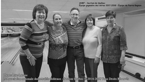
Équipe gagnante 2017-18 - Photo par Lise Lavoie

L'activité des quilles suscite beaucoup d'intérêt auprès de nos membres et continue d'être un franc succès. Si vous êtes intéressé(e) prière de communiquer avec Robert Blondeau ou Francine Godbout au (418)626-2802 . Le coût est de 10,00$ pour les joueurs réguliers et 6,00$ pour les remplaçants. Cette activité sociale a lieu le mardi après-midi à 12h50 au Centre Mgr Marcoux situé au 1885, chemin de la Canardière, Québec.